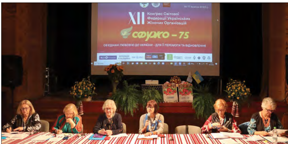
Президія XII конгресу Світової федерації українських жіночих організацій.

ПЕРЕМИШЛЬ, Польща. – В Українському народному домі 14-17 жовтня відбувся XII конгрес Світової федерації українських жіночих організацій та урочисте відзначення 75-річчя СФУЖО. Після обговорення низки важливих питань ділової частини річних нарад було прийнято Заяву СФУЖО з нагоди 75-ої річниці.