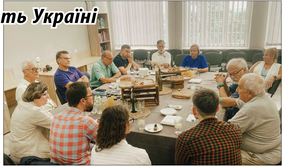
На засіданні круглого столу у Львові.

Доктор Айзенберг, кардіолог у Westchester Medical Center і Montefiore Hospital, майже цілий день перетворював випадки і хірургічні підходи у