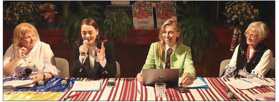
На круглому столі „Деколонізація в різних сферах“.

під час Світового конгресу українського жіноцтва у Філядельфії з основною метою відновлення незалежності України та об'єднання жінок українського походження по всьому світі для спільного підтримання українських інтересів.