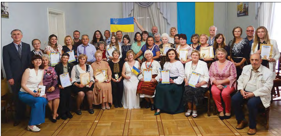
Учасники VII Всеукраїнського літературного конкурсу ім. Лесі Мартовича.

Леся Мартович, ім'ям якого названо конкурс, за життя написав 27 оповідань і помер у досить молодому віці в розпал Першої світової війни.