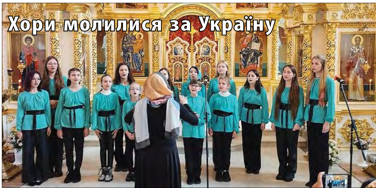
Виступає хор „Мажоринка“ дитячої музичної школи міста Новоукраїнка.

СТОКГОЛЬМ. – Міністер цивільної оборони Швеції Карл Оскар Боглін сказав 17 жовтня, що уряд ще розглядає можливий саботаж вже другого підводного кабеля телекомунікації на дні Балтійського моря. Тижнем раніше Фінляндія та Естонія висловились, що зриви газового нафтопроводу й телекомунікаційного кабеля правдоподібно були спричинені саботажем. Це викликало турботу про безпеку критичної інфраструктури Європи. Кабель знаходиться в територіальних водах Естонії. Естонські урядовці сказали, що незрозуміло, чи зрив кабеля до Швеції був пов'язаний з першим випадком з нафтопроводом і кабелем, який пов'язує країну з Фінляндією. Фінляндське Національне бюро розслідувань сказало, що воно розслідує перебування кількох кораблів в околиці під час того інциденту: один з кораблів має російського власника, а другий – китайського. („The Wall Street Journal“)