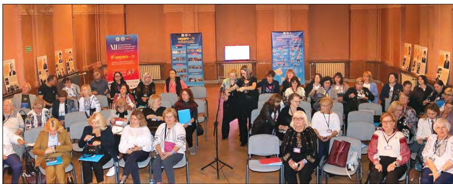
На XII конгресі Світової федерації українських жіночих організацій.