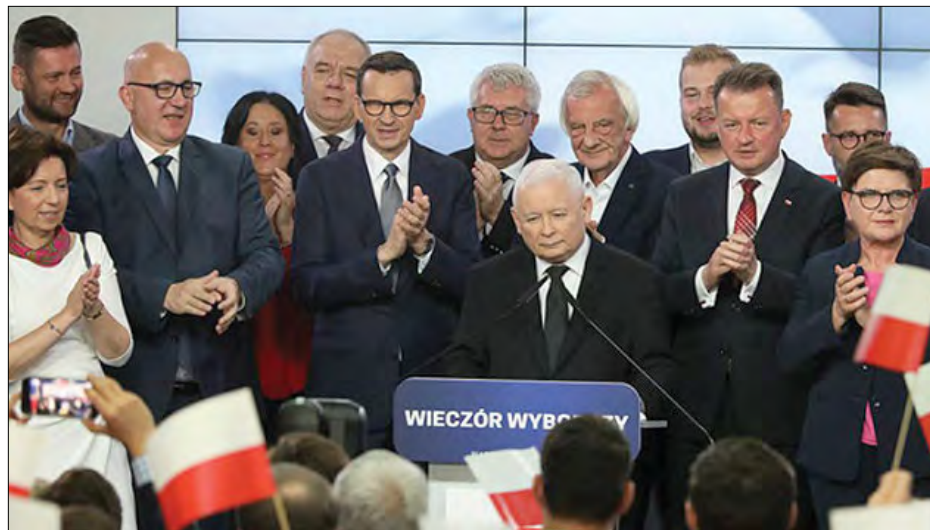
Партія „Право і справедливість“ святкує перемогу

17 жовтня Державна виборча комісія Польщі щодо виборів до Сейму та Сенату Республіки Польща повідомила: