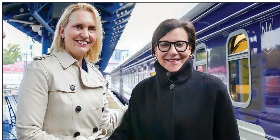
Пенні Пріцкер (справа) і Посол США в Україні Бріджит Брінк

КИЇВ. – Спеціальна представниця США з питань економічного відновлення України Пенні Пріцкер 16 жовтня прибула з візитою до Києва, повідомила Посол США в Україні Бріджит Брінк.