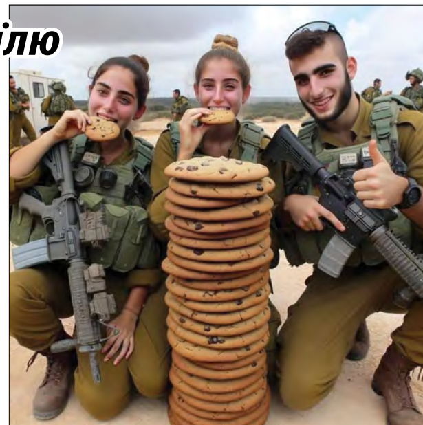
Смачні пряники для солдат.

Обстріл ракетами Ізраїлю для країни не було новим. А от пошкодження паркану, який мав захищати єврейську державу від сектора Газа, звичайним бульдозером та проникнення на територію понад 2,000 терористів, переодягнених у форму солдат Армії оборони Ізраїлю – це те, чого ще не було за всю історію державності, з 1948 року, хоча були війни, військові операції. Бойовикам за якусь