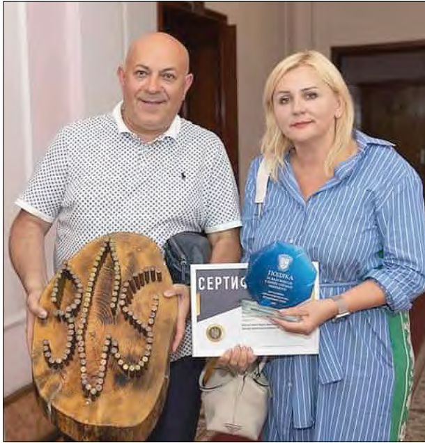
Під час благодійного авкціону.