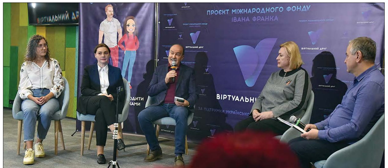
Триває розмова „Віртуальний друг“.